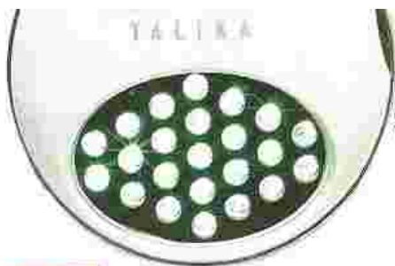
Light Duo, Talika, 245 €