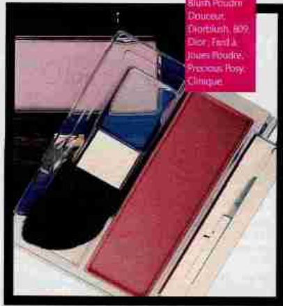
À poser haut sur la pommette Blush Poudre Douceur, Diorblush, 809, Dior, Fast à Jouer Poudre, Precious Hopy, Clinique