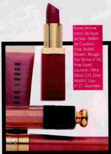
Roses bonne mine, de haut en bas : Rodolphe Couleux, Hise, Bobbi Brown, Rouge Pur Shine n° 16, Yves Saint Laurent, Ultra Gloss 333, Dior Addict Lips, N°23 Guerlain.