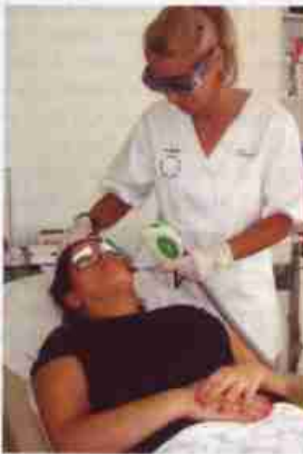
EN HAUT ET AU CENTRE: UNE SÉANCE DE GENTLEWAVES OPTIMISE LA SYNTHÈSE DU COLLAGÈNE EN QUELQUES SECONDES