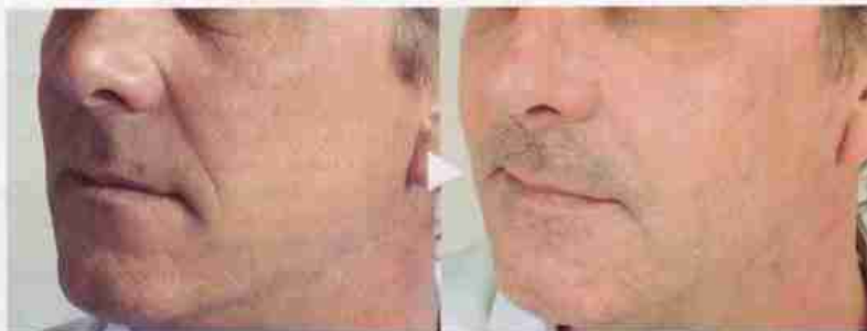
200H PROFIL 2006 ET 2007 TRAITE AVEC TEDDIAL ULTRA DEER LA CORRECTION DES SILLONS NASOGÉNÉRIENS ET DE LA VALLÉE DES LÈVRES EST TOUJOURS OPTIMALE APRÈS DIX- HUIT MOIS

Au fil des séances, la peau s'améliore, se retend, les rides et les ridules diminuent. Dans les cas où le double menton et les bajoues sont importants et très marqués, je pratique d'emblée une méso-lypolyse pour dissoudre les amas graisseux avec des injections de produits lipolytiques», précise le docteur Ghislaine Beilin, médecin esthétique.