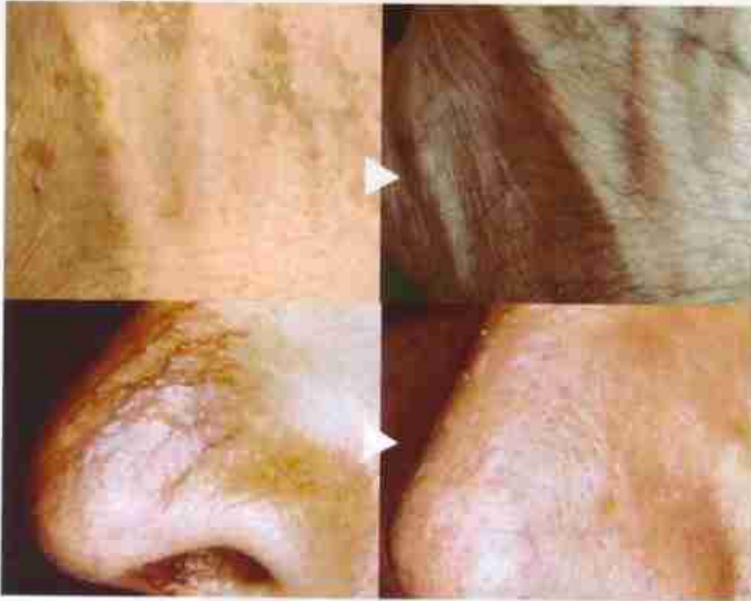
EN HAUT, SUR CÉS MAINS, LE CHOIX DU TRAITEMENT DÉPEND DE L'INDICATION MÉDICALE. CI-DESSOUS, COUPEROSE TRAITÉE PAR LASER