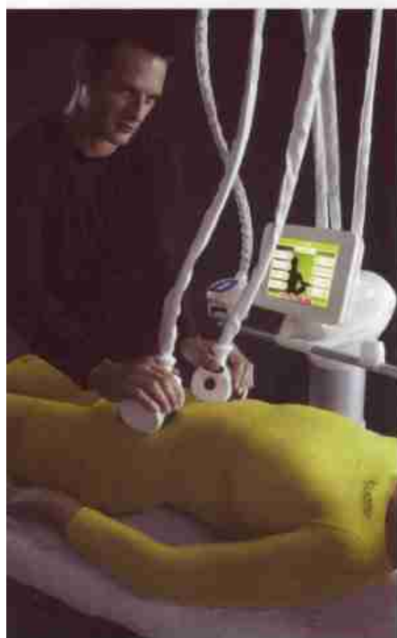
ICÔNE, UNE MÉTHODE QUI DONNE DE TRÈS BONS RÉSULTATS.