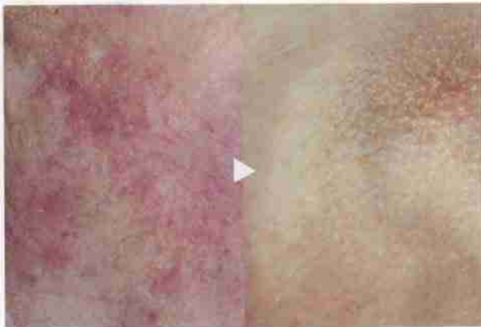
PRÉ-CANCÉRIE CUTANÉE AVANT ET APRÈS TRAITEMENT (PHOTOS DR ANNE LE PILLOUËR-PROST)

Lorsque les taches pigmentaires dues au vieillissement et aux expositions répétées au soleil sont plus importantes, il est prescrit une séance de lampe Flash, type IPL, sur l'ensemble du visage. En une seule séance, une diminution de l'intensité de leur coloration est obtenue. Mais il est souvent nécessaire de renouveler le traitement. Aucune douleur à part quelques sensations de picotement et de chaleur pendant le soin. Prix : de 100 à 300 euros.